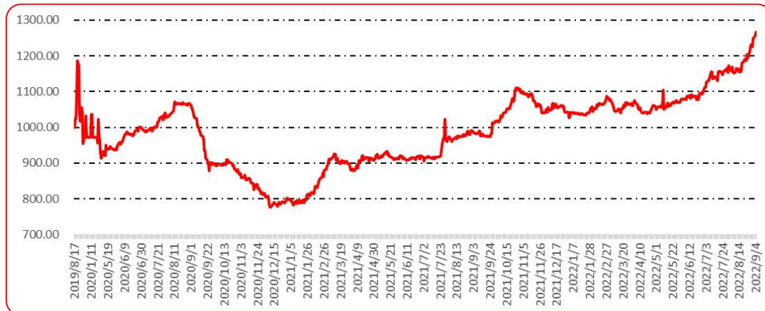
图 9 新一代（干椒）批发价格指数运行图