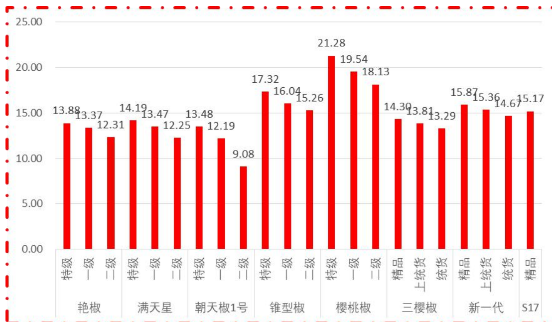
图 1 各品种、各等级周度均价