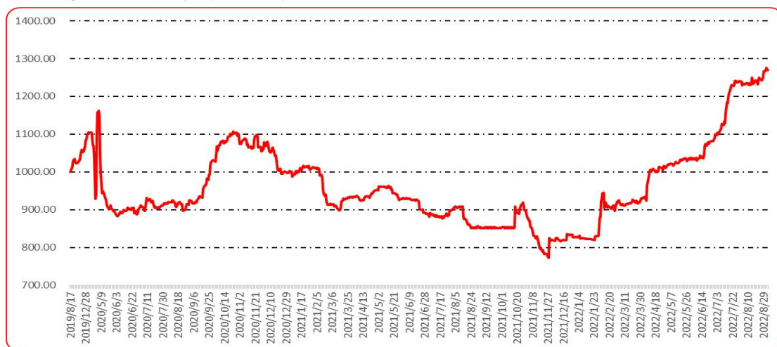
图 10 印度进口椒批发价格指数运行图