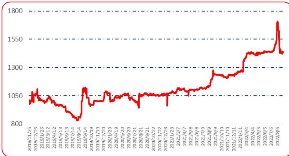
图 6 锥形椒批发价格指数运行图