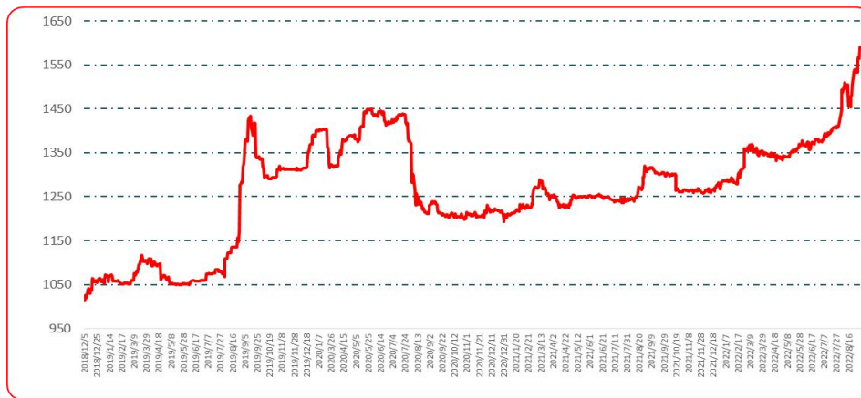
图 2 中国遵义朝天椒（干椒）批发价格综合指数运行图