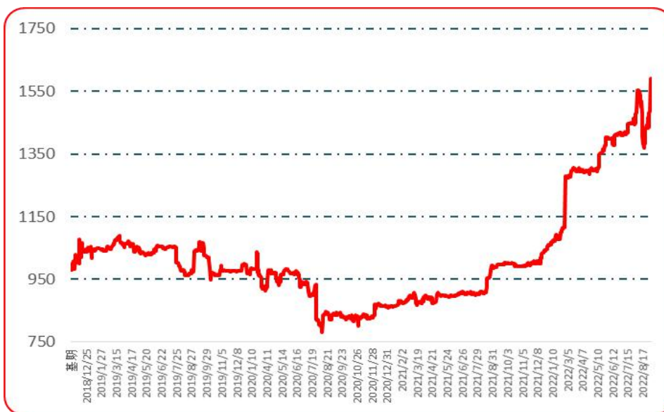
图 7 樱桃形椒批发价格指数运行图