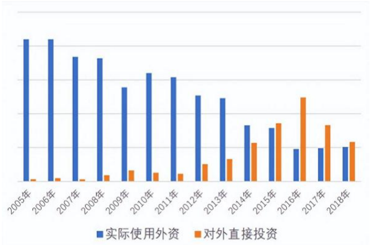
图表 2：2005-2018 年中国 6 个劳动力密集型产业使用外资与对外投资对比