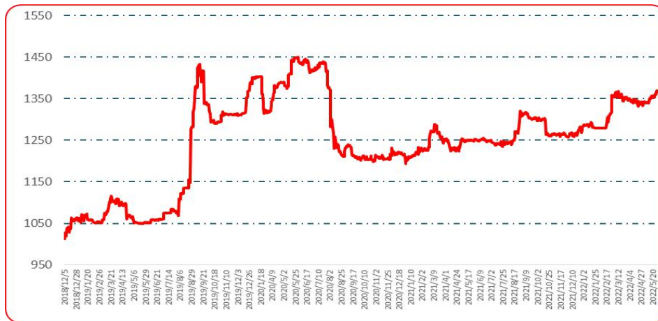
图 2 中国遵义朝天椒（干椒）批发价格综合指数运行图