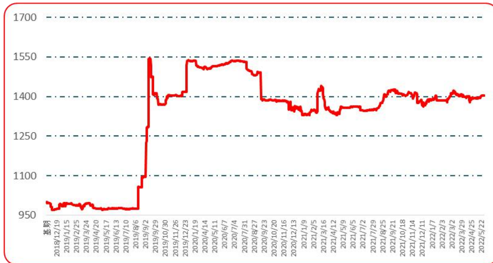
图 5 遵义朝天椒 1 号批发价格指数运行图