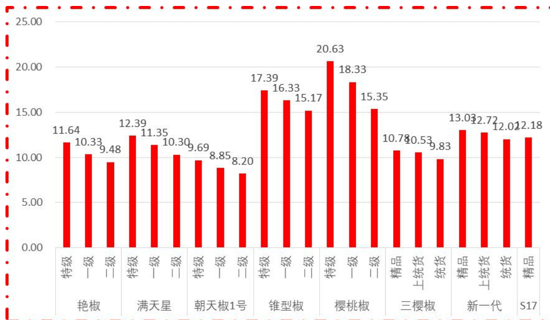
图 1 各品种、各等级周度均价