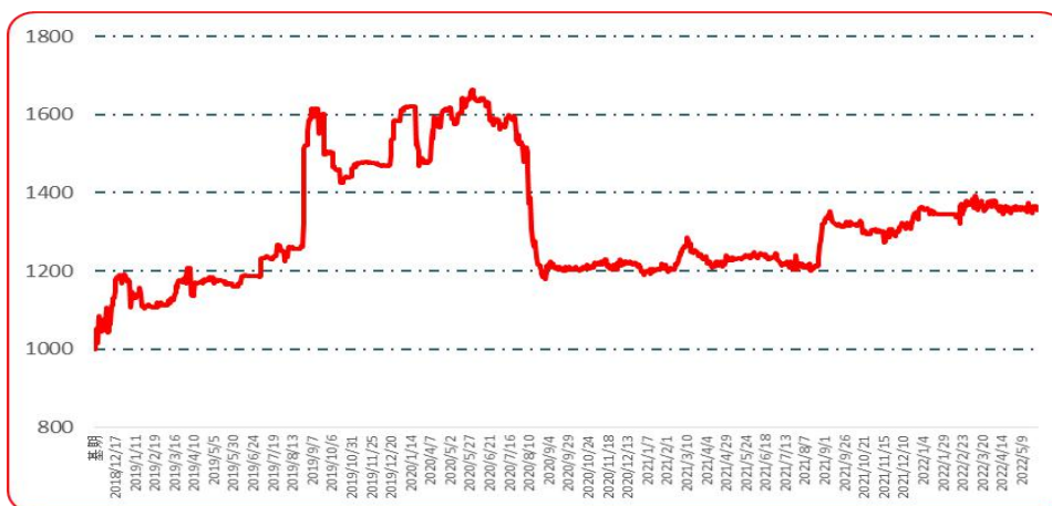
图 3 艳椒批发价格指数运行图