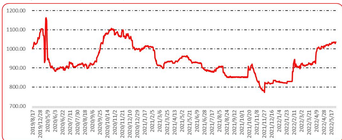
图 10 印度进口椒批发价格指数运行图