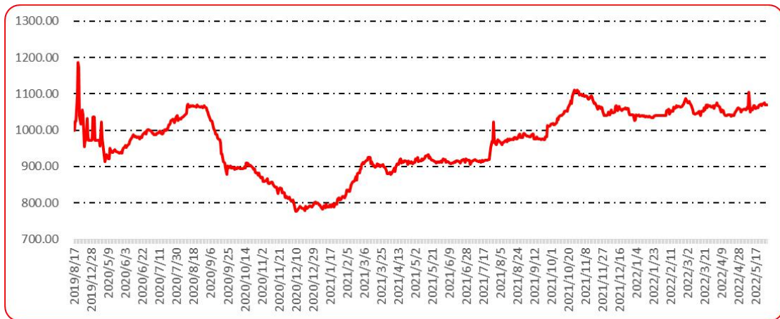
图 9 新一代（干椒）批发价格指数运行图