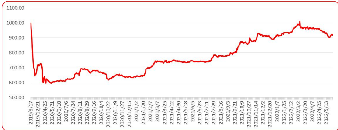
图 8 三樱椒（干椒）批发价格指数运行图